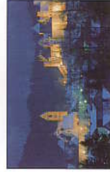
Hoher Schloss, Basilika St. Mang