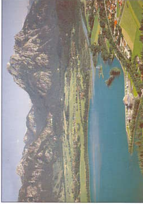
Musical Theater Neuschwanstein